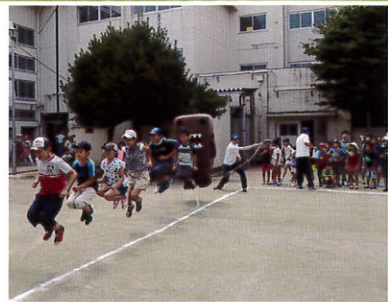
10月8日(日)NHKBSプレミアム「みんなDEどーもくん!!」で放送されました。

7月22日(土)に、毎年恒例の「夏休み子どもレクリエーション」が三ツ境小学校で開催されました。児童240名に加えて、今年はNHKのどーもくんも参加してくれました。どーもくんと一緒に、ドッチビー、大縄跳びグラウンドゴルフ、ナインボードを楽しんだ後は、みんなで作ったカレーライスは何杯もお代わりし、笑顔いっぱいの日でした。当日はとても暑く、どーもくんも汗だくでした(笑)(三浦)