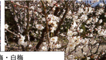
見事な紅梅・白梅