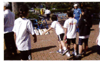
【さわやかスポーツの普及】

スポーツ振興法並びに横浜市体育指導委員規則に基づき、横浜市長から委嘱された特別非常勤公務員です。スポーツ行政の推進者として、地域に根ざしたスポーツ・レクリエーションの振興事業を展開していく役割を担っています。