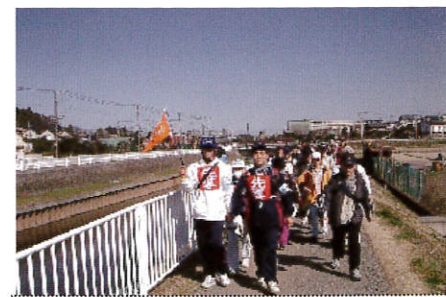
一路南に、引地川の流れに沿って