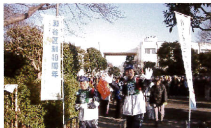
それでは行ってきます！ 江ノ島コースの出発