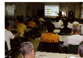
【スポーツと安全管理講義】