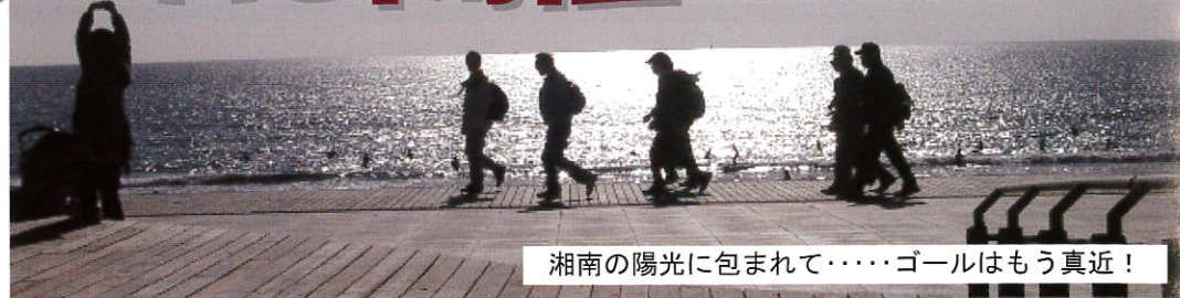
湘南の陽光に包まれて……ゴールはもう真近！

2月8日(日)、第17回瀬谷ふるさとウォーク大会(主催:瀬谷ふるさとウォーク大会実行委員会、共催:瀬谷区役所、瀬谷区体育指導委員連絡協議会)が「春の予感・湘南のんびりウォーク」のサブタイトル通りの好天のもと、「六会コース」「江ノ島コース」の2コースに759名の参加者を集めて盛大に開催されました。