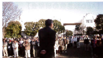
気温4℃の中の開会式 関・瀬谷区長も元気イッパイ

思い起こせば昨年の大会は史上初の積雪による中止。今年は打って変わって春陽うららかな絶好のハイキング日和となりました。 12kmの六会コースに340名、24kmの江ノ島コースには419名の区民がエントリー。二ツ橋公園での受付・開会式のあと、8時20分に江ノ島コースから順次スタートしました。