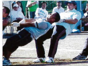
30秒間 力が入ります

10月11日(祝)青空の中第44回レクリエーション大会が行われました。プログラムの中で、大いに盛り上がるものがあります。綱引きは、30秒1本勝負、予選、準決勝、決勝を行います。大縄跳びは、跳んだ回数が多い方が勝利します。地区年齢別リレー(男女別)では予選なしのタイムレースで行われます。各チームとも大声援を送りました。