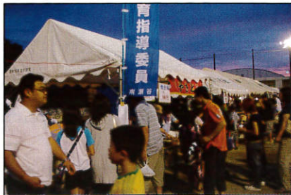
完売も出た 模擬店

8月7日(土)8日(日)に連合主催「夏祭り」を開催。当日は模擬店「18店舗」焼き鳥、焼きそば、フランク等、各自治会の協力で出店しました。又、子供みこし、カラオケ大会、盆踊りと大変盛り上がった2日間でした。体育指導委員は本部拠点の設営及び終了後の撤去を任務とし協力をしました。さらには、「焼き鳥」「焼きおむすび」を提供する模擬店を出しお祭りを盛り上げました。