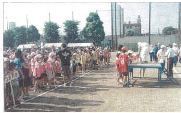
瀬谷中グラウンドに 集合!

去る7月25日(日)、瀬谷中グラウンドに朝早く相沢連合町内会8地区の多くの小学生及び家族、役員関係者が集まりました。昨年度優勝地区チームの選手宣誓、組合せ抽選会を行い、球技大会がスタートしました。男子キックベースボール、女子ソフトバレーボールの熱戦が繰り広げられました。午後優勝チーム以下が接戦を勝抜き勝利カップを手に入れました。