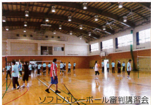
ソフトバレーボール審判講習会

体育指導委員は、区民の皆様とご一緒に健康増進・体力強化の手助けができるように常に、研鑽努力をして行きます。今後とも、体育指導委員の活動に理解と協力及び地域行事への参加をよろしくお願い致します。