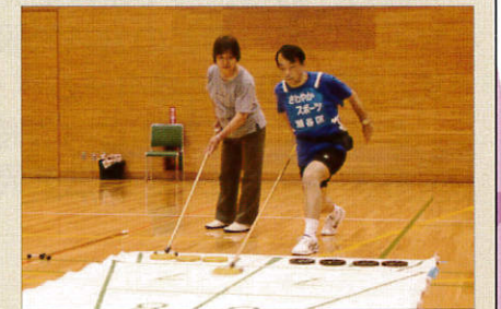
シャッフルボード

※さわやかスポーツ普及委員会は、体育指導委員(各地区から1名選出)をはじめ、青少年指導員、老人クラブ、生涯スポーツ指導者協会等により構成されており、横浜市が推奨する「いつでも、どこでも、だれでも」楽しめる、さわやかスポーツの普及に努めています。