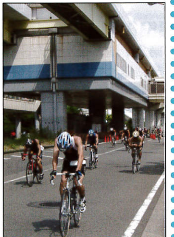
シーサイドライン福浦駅前

当日は猛暑のなか、朝8時半から3時間に及び熱戦が繰り広げられました。私たち体育指導委員も、選手に「ガンバレー」の声援と拍手で応援。選手からは、「アリガトー」の声が返ってくるなど、猛暑のなかでありましたが、心はさわやかに、無事に任務を終了することができました。皆さんお疲れ様でした。