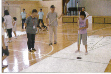
初めてなのに上手ですね

7月17日二ツ橋小学校で実施したシャッフルボード大会は、地区体育指導委員の初めての取り組みでした。5月末から宣伝に努めましたが、参加者を募るのに苦労しました。大会には二ツ橋小はまっ子の子供たちが大勢参加し、地域の大人15名と楽しく交流ゲームができました。「ぜひ自分の自治会でもやりたい」との声もありました。来年も企画します。孫と対決しませんか。