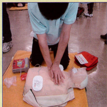
想像以上にチカラが必要です。

ところで、イザ！という時、あなたは冷静に対処できますか？人工呼吸や心臓マッサージができますか？是非、機会を見つけて、あなたも救命講習を受講してみてください。