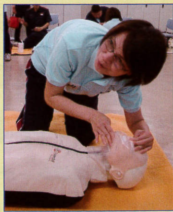
こんな感じていいですか？

スポーツ大会などのイベント開催時に、無料でAEDを借りることができます。お問い合わせは瀬谷消防署（TEL 045-362-0119）まで。