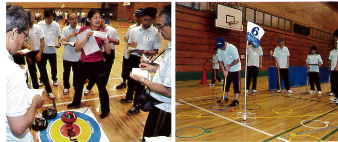
カローリング(左)は、より実戦に即した講習内容。グラウンドゴルフ(右)は、まずは競技の楽しさを体験する講習内容。色つきの丸はバンカーで入ると+1打。

6月17日(日)、瀬谷スポーツセンターにてスポーツ推進委員競技審判講習会が開催され、カローリングとグラウンドゴルフの2競技について実際にゲームをしながらルールと審判の技術を学びました。カローリングはボナスイニングなどカローリングとは異なる採点方法に活発に質問が出ました。グラウンドゴルフは前日の雨によるグラウンド不良のため、体育館で室内用ボール(突起がついて止まりやすくなっている)を使って講習が行われました。コースレイアウトを受講者で考えるなど楽しい講習内容で1打1打に歓声が上がっていました。