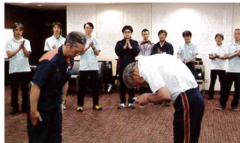
瀬谷消防署より「普通救命講習 I 修了証」が受講者一人ひとりに手渡されました。

5月26日(土)、40名のスポーツ推進委員が瀬谷区役所5階大会議室に集まりました。目的はAED(自動体外式除細動器)の使用法の完全マスター。瀬谷消防署の協力を得てまずは心肺蘇生に関する講義、講習ビデオを視聴。その後は全員交代で訓練用的人形とAEDを使用しての実技講習に取り組みました。AEDの操作は音声ガイドに沿って実施するので意外と簡単。大切なのはAEDが届くまでの人工呼吸や胸部圧迫など、正確で素早い初期対応です。いざという時に慌てずに適切な対応が取れるよう、熱心に受講した結果、全員に「普通救命講習 I 修了証」が交付されました。