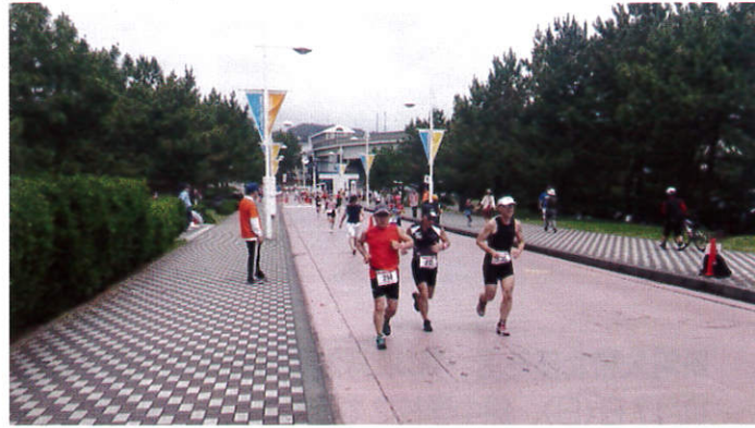
後方に見えるのがシーサイドライン八景島駅。選手は最後の力を振り絞って八景島シーパラダイスのゴールを目指す。

2012年7月8日(日)、八景島シーパラダイスをスタート・ゴールとする第3回横浜シーサイドトライアスロン大会が開催されました。瀬谷区スポーツ推進委員は、海の公園から八景島間でランコースの警備を担当。スイム・バイクとこなした選手が最後の力を振り絞り激走する姿に、私達も思わず拍手で応援していました。