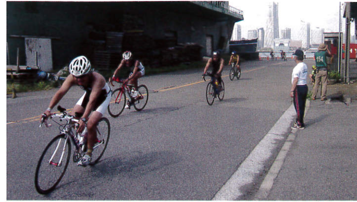
山下埠頭のバイクコースを警備する瀬谷区スポーツ推進委員。海向こうにランドマークタワーやウィーンズスクエアが見える。

9月29・30日に2012世界トライアスロンシリーズ横浜大会が山下公園を拠点に開催されました。瀬谷区スポーツ推進委員は30日(日)エイジ(一般)の部のバイクコースの警備を担当。台風の影響が一時雨に見舞われて転倒する選手もいましたが大きな怪我もなく、限界に挑戦する選手の奮闘に感動しっぱなし。あっという間の半日でした。