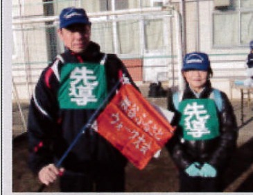
■私たちが先導します