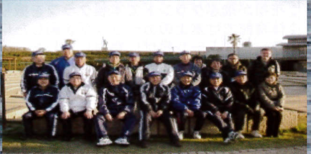
■実行委員会の皆さんの笑顔で照らす夕日もだいぶん傾いたね。お疲れ様でした