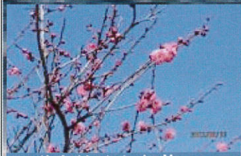
■咲き始めた紅梅。ウグイスはまだかな？