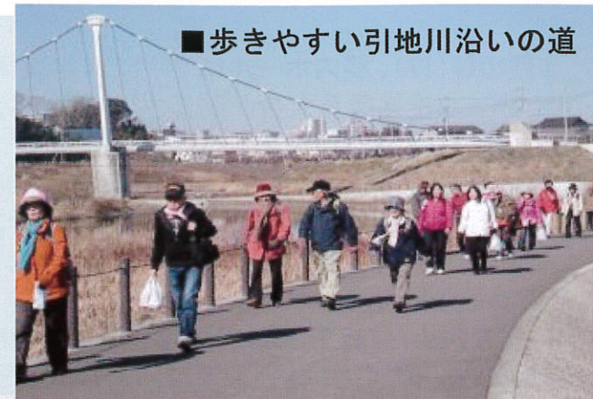
■歩きやすい引地川沿いの道

スタート地点は、昨年同様24kmコースの瀬谷中学校と、14kmコースの湘南台公園の2か所。約700名の参加者がゴールの湘南海岸公園・サーフビレッジを目指して一路ミナミへ南へ。リピーターも多いこの大会、今年も例年になく暖かな無風状態。時々顔を出す富士山を楽しみながら仲間同士、あるいは家族で和気あいあいと足取りも軽く歩を進めました。途中の引地川親水公園は絶妙のお弁当スポット。咲き始めた紅梅や菜の花のそばでランチタイムを楽しむ沢山のグループで広大な芝生の公園もにぎやかです。ゴール地点のサーフビレッジは文字通り湘南のサーフィンとビーチバレーボールの聖地なのです。それぞれ24kmと14kmを歩き通し無事ゴールした参加者は、完歩証と記念品を手にと達成感に満ちた顔で柔らかな潮風に深呼吸している姿が印象的でした。来年はあなたも是非チャレンジしてみてもいいのではないでしょうか？