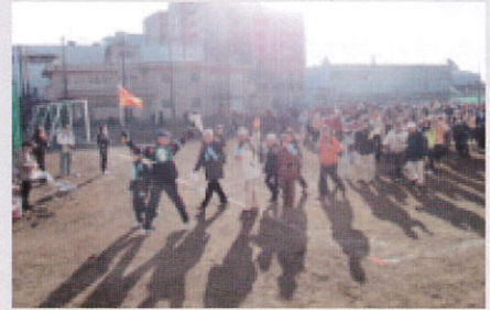
■いざスタート！低い朝日に参加者の影も長い長い！！