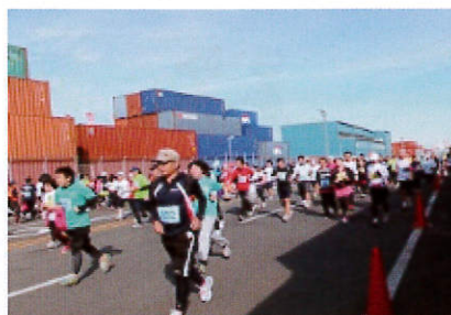
10km折返点を激走する選手たち

■第32回横浜マラソン大会は2012年12月2日（日）、山下公園を発着地点とし、北は北海道から南は九州まで、全国から9400名の市民ランナーが参加。30人の瀬谷区スポーツ推進委員はD突堤シンボルトワー近くの10Km折り返し地点という重要ポイントの沿道警備を担当しました。