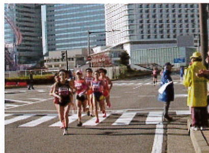
黄色いコートがスポーツ推進委員

■第4回横浜国際女子マラソンは2012年11月18日（日）に好天・強風の中で開催されました。瀬谷区からは50人のスポーツ推進委員が沿道警備に協力。観光客で賑わうみなとみらい・サークルウオーク付近の警備を担当しました。