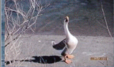
■引地川で遊んでいたヘンな鳥