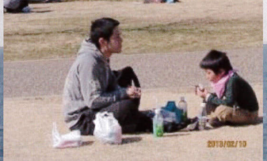
■パパ、やっぱりお弁当オイシイね(引地川親水公園にて)