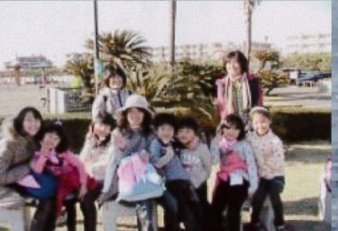
■三ツ境小学校の生徒グループ。子供用の完歩賞があると嬉しいな