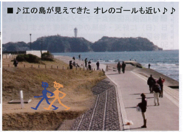
■江の島が見えてきた オレのゴールも近い♪♪