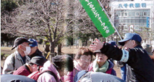
■湘南台公園ではBコースの受付開始。ゆったり無理なく参加したい人にはオススメのコースです。