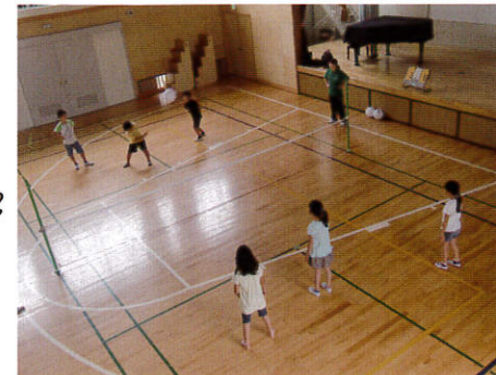
(バウンズボールを楽しむ子ども達)