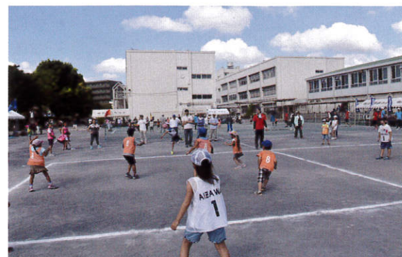
(ボールから逃げろ~!!)

7月31日(日)瀬谷小学校にて第46回子ども球技大会が開催されました。当日は暑い中、低学年はソフトドッチボール高学年はソフトバレーボールで対戦し、毎試合地域の方々が応援していただき、大いに盛り上がりました。(担当 佐藤)