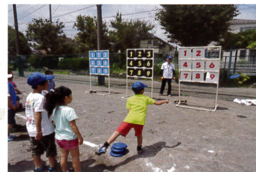
(あっ!?はずれちゃった!)