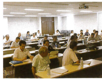
(知識向上のため勉強中)