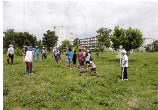
(上手く投げられるかな!!)

当日は、48名の方が参加し、瀬谷区フライングディスク協会委員の指導のもと数グループに分かれプレーを楽しみました。(担当 石山)