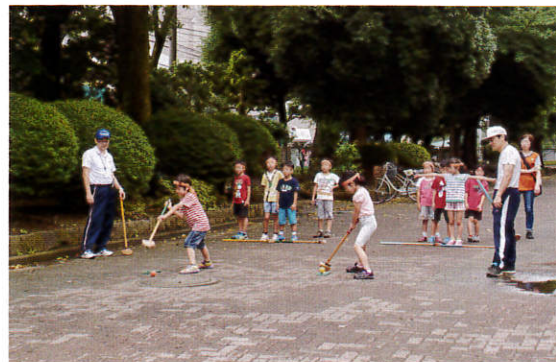
(グラウンドゴルフ挑戦中!!)

6月25日(土)午前中、瀬谷小学校で第一連合子ども会主催のDo!スポーツが開催されました。スポーツ推進委員は青少年指導員の方々と共に、体育館での綱引きやボールリレー、校庭でのドッチボール、フライングディスク、グラウンドゴルフの5種目に分かれて進行を担当しました。前夜までの雨でグラウンドには水たまりができていましたが、開始までに汗だくになりながらも整備し全種目を行うことができました。梅雨の合間、校庭にも子ども達の歓声があふれました。(担当 加茂)