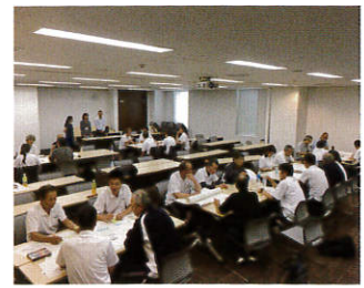
(テーマに沿ってグループディスカッション)