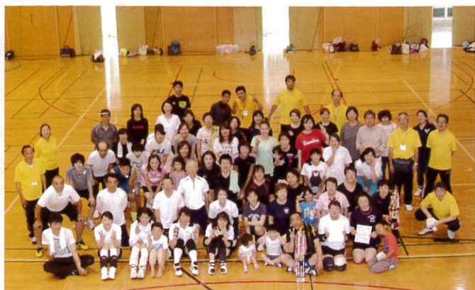
(熱戦後、爽やかな表情の参加者たち)

6月12日(日)原中学校で、阿久和北部地区スポーツ推進委員主催による「第42回女子バレーボール大会」が開催されました。参加された6チームは、抽選にて2ブロック各3チームに分かれて総当たりの予選リーグを行った後、同順位ごとで対戦する順位決定戦の結果、明和自治会混合チームが優勝。地域の方々が多数来場され熱い声援が送られました。(担当 伊熊)