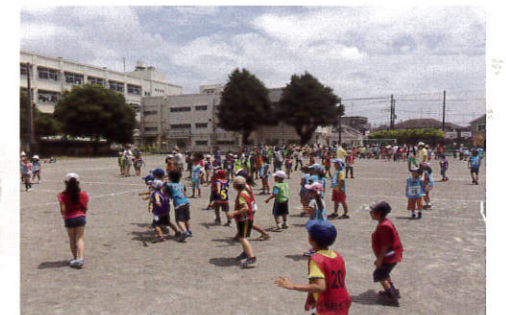
(逃げ惑う子ども達)