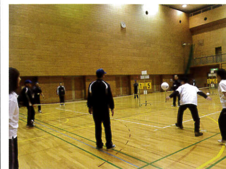
<白熱したバウンズボールの試合！>

試合の後は、近隣の集会場に集合し懇親会が行われ、各地区の年間の活動報告や30期で退任される方々の挨拶などがあり、各地区のスポ推仲間との楽しいひと時が過ごせました。(担当 伊熊)