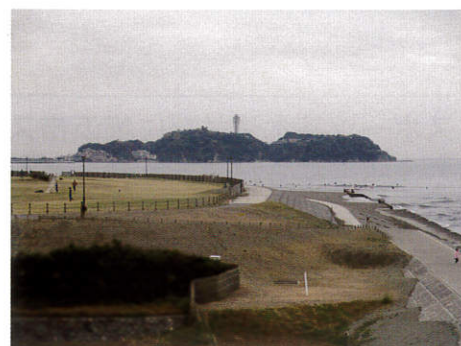
<サーフビレッジから江ノ島>

横浜市では、18歳以上の市民の方に歩数計を持って楽しみながら健康づくりを進めて頂く事業「よこはまウォーキングポイント事業」を実施しております。事業に参加することでもらえる歩数計を身につけウォーキングを行うと、記録された歩数に応じてポイントをゲット。ポイントを貯めると、抽選でプレゼントが当たります。