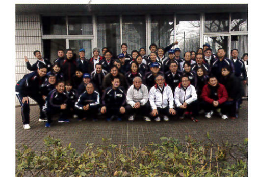
<いい汗かきました！>