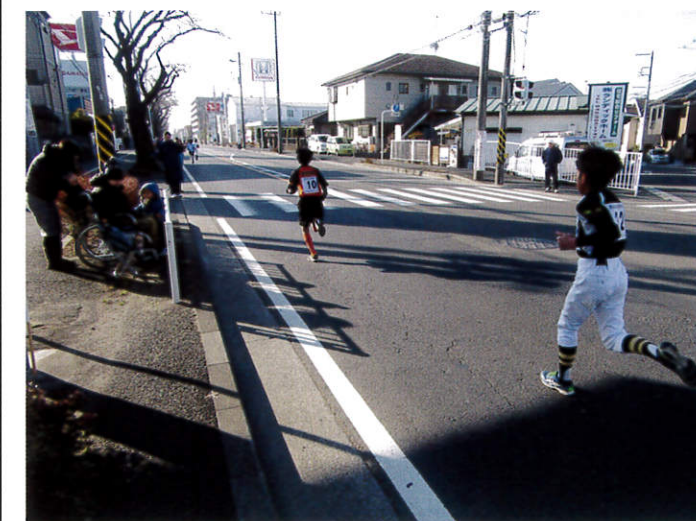
<海軍道路を走り抜けるランナー>

平成29年1月22日(日)第47回瀬谷区マラソン大会が開催されました。当日は比較的穏やかな天候の中、約920名の参加者が種目別に3km、5km、10kmで競い合いました。海軍道路を中心に我々スポーツ推進委員も沿道警備等を担当しましたが、警備をしつつも一生懸命に走るランナーを見ると沿道の皆さんと一緒に応援をしてしまいました。(担当 佐藤)